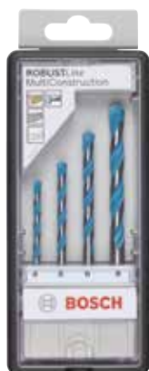
Размер набора A: 156,5 x 69,5 x 23 мм