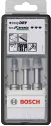
Размер набора А: 156,5 x 69,5 x 23 мм